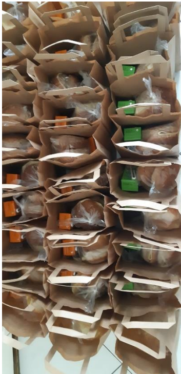
30 maaltijden om uit te delen