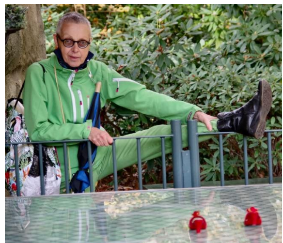
De rode schoentjes in de Efteling