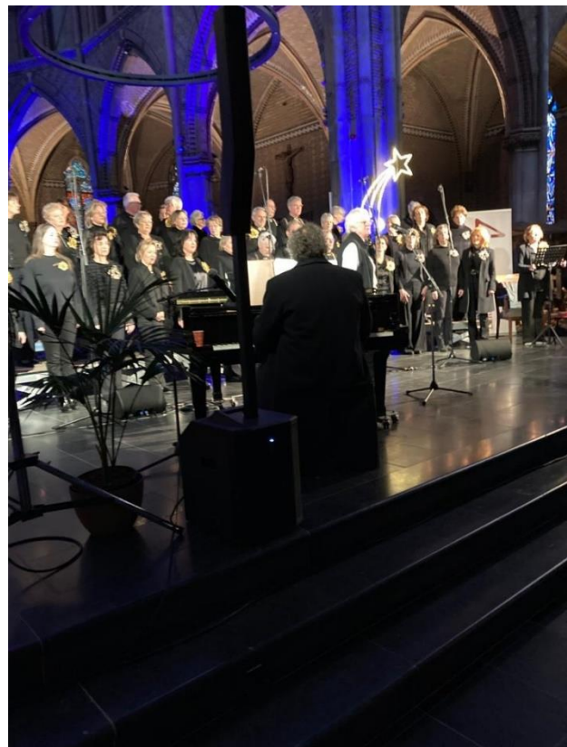
Kerstconcert 4Tune Entertainment