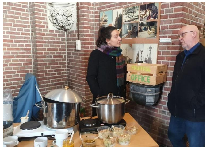
Soep & Co in de Petruskerk