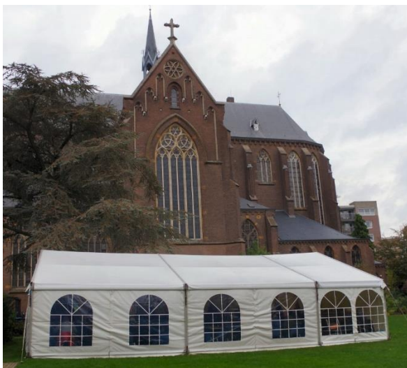
Feesttent bij de Petruskerk