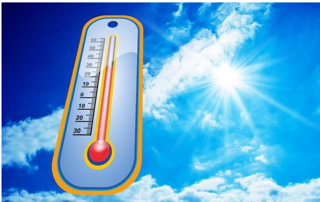
De warme zomer van 2022