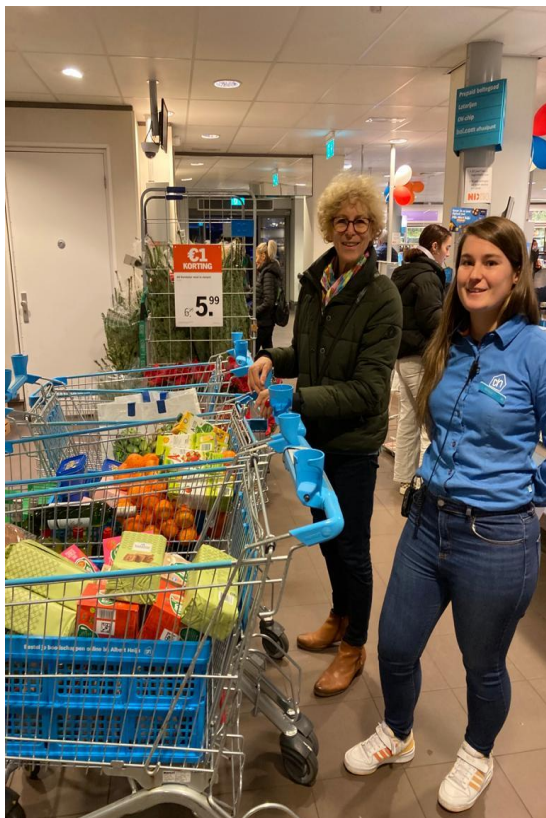
Emballagebonnen omgezet in boodschappen