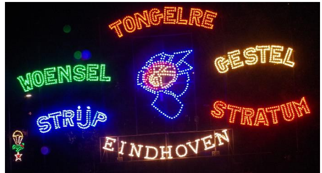
Wijken van Eindhoven