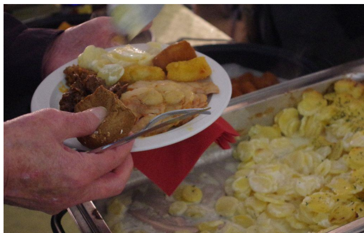
Iedereen had een bord vol