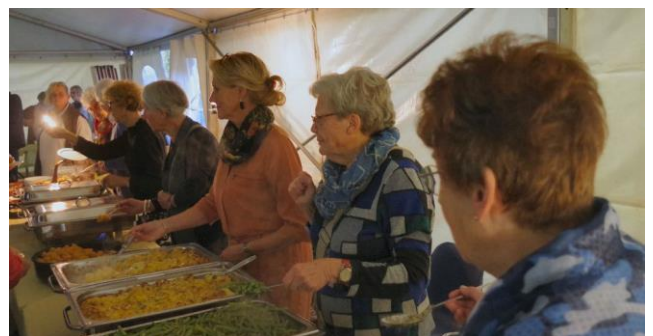
Vele handen scheppen op